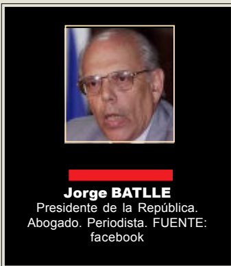
Jorge BATLLE Presidente de la República. Abogado. Periodista.

Ahora descubren que el Gobierno tiene un déficit mayor al 3,5% sobre el producto. Descubren que la inflación es altísima, descubren que el tipo de cambio no alcanza para exportar los productos primarios. Descubren que las empresas no están en condiciones de aumentar los salarios. Descubren que el Mercosur no funciona.