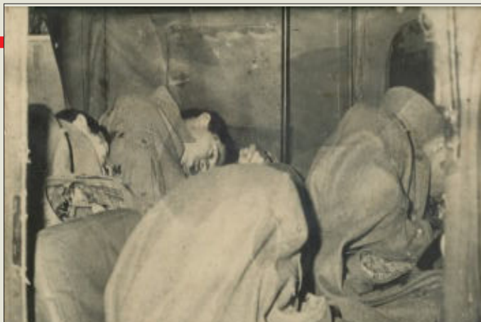
18 de mayo de 1972. Cuatro soldados acribillados por un comando tupamaro en av. Italia y Abacú. Eran tiempos de democracia: el Parlamento y la Justicia funcionaban a pleno. Eran custodios de un jefe militar y estaban en un jeep.

De los 28 o 29 desaparecidos que estableció la Comisión para la Paz, han aparecido cuatro restos. Que se siga buscando a mí me parece bien, debe hacerse, pero lo que no se puede justificar es que arriba de esta causa legítima se monten otras cosas. Una,