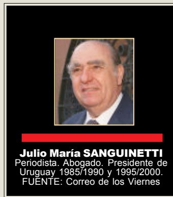
Julio María SANGUINETTI Periodista. Abogado. Presidente de Uruguay 1985/1990 y 1995/2000.

Quiere decir que el país en lo básico y sustantivo, el país vio a estas amnistías y al denominado «cambo en paz», muy positivamente, el tema es el remanente, esas situaciones tan penosas que son la de los desaparecidos, donde hay un derecho sagrado de los familiares, con su expresión de dolor legítima, de saber