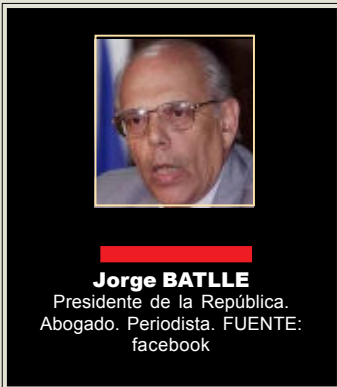
Jorge BATLLE Presidente de la República. Abogado. Periodista.