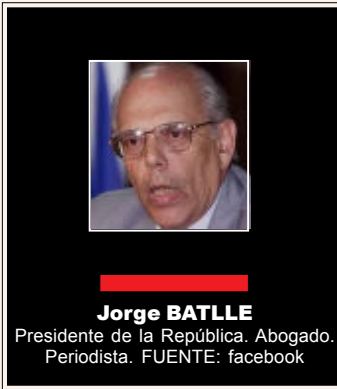
Jorge BATLLE Presidente de la República. Abogado. Periodista.

Tendremos años difíciles. Los que más sufren son siempre los que menos tienen. Menos educación, menos oportunidades. Esos son los primeros excluidos. No hay inclusión en un país cerrado.