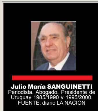
Julio María SANGUINETTI Periodista. Abogado. Presidente de Uruguay 1985/1990 y 1995/2000.