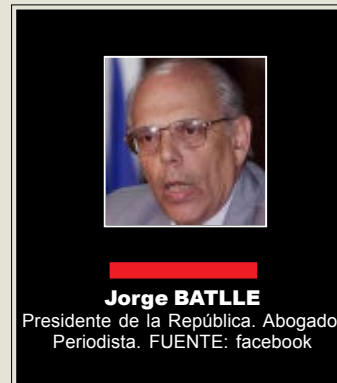
Jorge BATLLE Presidente de la República. Abogado. Periodista.

Mujica a los abrazos con Lula y Lula a los abrazos con las empresas.