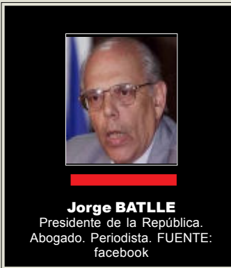
Jorge BATLLE Presidente de la República. Abogado. Periodista. FUENTE: facebook

Pero sabemos ya quién es el culpable: el FRENTE AMPLIO.