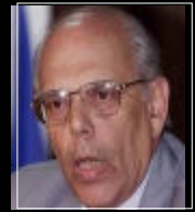
Jorge BATLLE Presidente de la República. Abogado. Periodista.

organización. No se ha comprobado por ahora. Pero en cualquier caso, él personalmente se asumía como islámico, usaba un nombre árabe en el Facebook y estaba inclinado hacia ese mundo tan ajeno a los valores y costumbres de nuestro país. Uno tiende a pensar que en un país como el