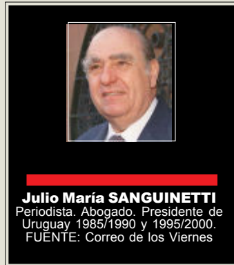
Julio María SANGUINETTI Periodista. Abogado. Presidente de Uruguay 1985/1990 y 1995/2000. FUENTE: Correo de los Viernes

ciudadanos a los que sorprenden maliciosamente. Es lo que ha pasado en la ciudad de Paysandú y esto aproxima el episodio a este cuadro más