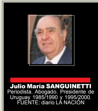
Julio María SANGUINETTI Periodista. Abogado. Presidente de Uruguay 1985/1990 y 1995/2000. FUENTE: diario LA NACIÓN

esa real condición. Podrán las personas haber nacido aquí, tener un documento e identificar su nacionalidad en el fútbol, pero con esos solos ingredientes no se construye la conciencia de los derechos y los deberes de una vida en sociedad y de un ejercicio cívico responsable.