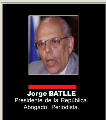
Jorge BATLLE Abogado de la República. Abogado. Periodista.

En la reunión de los 25 años del Mercosur, a la que no asistí, el Dr. Vázquez, Presidente de la República Oriental del Uruguay, no se sentó con los Presidentes Sanguinetti y Lacalle sino junto a los parlamentarios para señalar así cuál es el sistema que le gusta. Prefiere a los gobiernos que destruyen la economía en sus países, como es el caso de la dupla nacional Mujica-Vázquez. No sé si le gusta la corrupción, pero por lo menos se ve que no le incomoda.