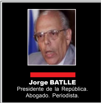
Jorge BATLLE Presidente de la República. Abogado. Periodista.

Presidente para bajar el gasto público al punto que no se sabe, ni siquiera, si van a cumplir con el acuerdo de rendición de cuentas. Están en rebelión destructiva, siendo que además son los responsables de lo que están pasando. Se quejan de lo que ellos mismo impulsaron a hacer al Presidente Mujica. Gaste todo lo que tenga y si puede más, más. Esta es la dura realidad que enfrenta el Presidente Vázquez. No le funciona el Mercosur, no sabe qué hacer con las leyes para la seguridad, no consigue los votos después de haber hecho una reunión, sin Astori, rodeado de los diputados de la izquierda radical que lo dominan. Qué calvario para el Presidente. Qué tremendas dificultades le esperan a un país que acumula deuda porque tiene 2200 millones de dólares de déficit anual que lo paga solamente pidiendo plata prestada. ¿Y esto cómo termina?: con ajuste, más ajustes, más debilitamiento productivo y más sufrimiento para los que menos tienen. Como dije hace mucho tiempo: la izquierda los quiere tanto a los pobres que los multiplica. ■