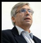
Tabaré VIERA Diputado. Fue Senador, Presidente de Antel, Director de OSE e Intendente de Rivera giboemos 2000/05-2005/10