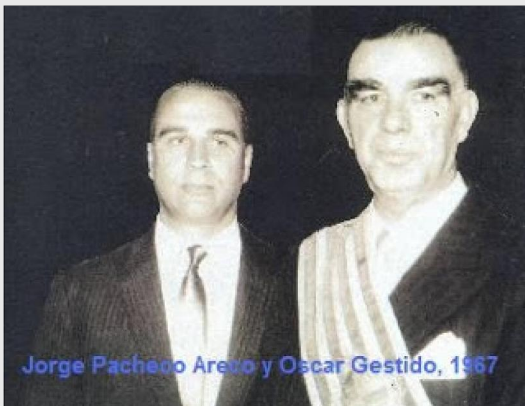
Jorge Pacheco Areco y Oscar Gestido, 1967

la visible caída de los valores políticos tradicionales. Gestido no triunfará en los 9 meses de su mandato contra la crisis económica, la crisis política, la guerrilla y con su salud. Pacheco Areco será el hombre fuerte que quería la ciudadanía. Queda bastante lejos el batllismo, incluso con la