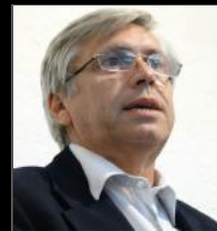
Tabaré VIERA Diputado. Fue Senador, Presidente de Antel, Director de OSE e Intendente de Rivera (2000/05-2005/10)

mitad de los '90 junto a un grupo de amigos riverenses, jóvenes profesionales y varios dirigentes políticos nos propusimos construir un espacio político muy abierto como